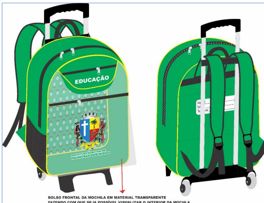
IMAGEM MERAMENTE ILUSTRATIVAS DA MOCHILA DO LOTE 01: