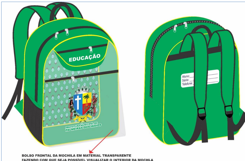
IMAGEM MERAMENTE ILUSTRATIVAS DA MOCHILA DO LOTE 04: